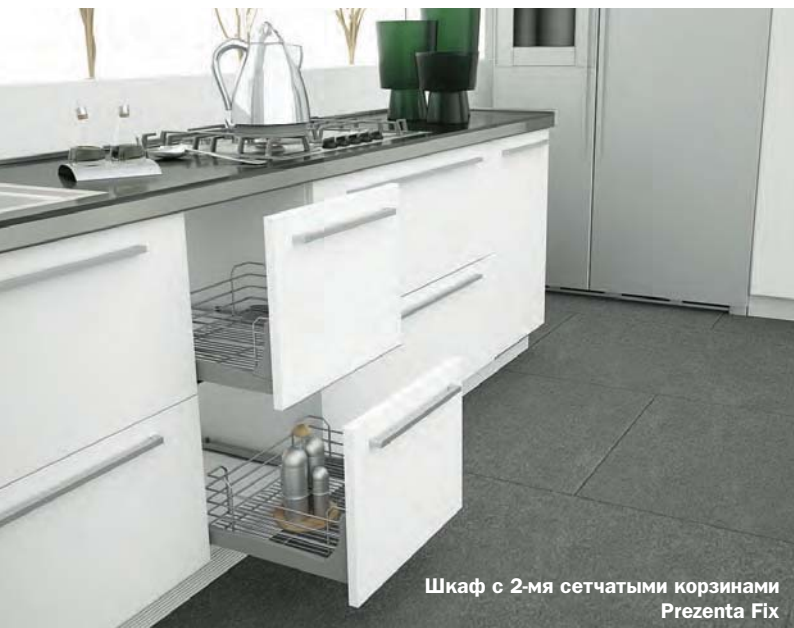
Шкаф с 2-мя сетчатыми корзинами Prezenta Fix

Элегантный и функциональный выдвижной ящик с минимальными усилиями