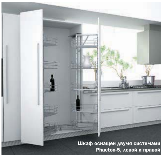
Шкаф оснащен двумя системами Phaeton-5, левой и правой

Выдвижная поворотная система с пятью корзинами и креплением фасада