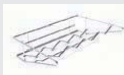
Арт. 27100112 Полка для хранения бутылок, 1 шт.